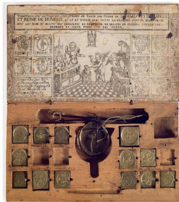
Weegschaal van een wisselaar, eind 18 de - 19 de eeuw, hout, ijzer, koper. Collectie Jean Lescarts, eigendom van de Stad Bergen.

Straatnamen, winkels, taal, ambachtswerk van gisteren en vandaag ... De stad Bergen barst van de schatten die van een bloeiend verleden getuigen. Hoe heeft de handel de ontwikkeling en organisatie van de stad beïnvloed? Welke soort uitwisselingen liggen aan de basis van de vakkennis en uitstraling van de stad Bergen? Wat is de bijdrage van de migratiestromen en sociale diversiteit aan het evenwicht van de stad - vroeger, nu en in de toekomst? Werkgelegenheid, lokale handel, circulaire economie, de relokalisatie van vakmanschap ... Welke uitdagingen mogen we morgen verwachten?