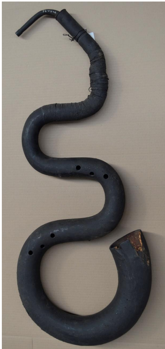
Serpent, blaasinstrument, begin 17de eeuw, hout. Collectie Jean Lescarts, eigendom van de Stad Bergen.

De Bergense cultuur heeft zijn wortels in een geschiedenis die tot het paleolithicum teruggaat.. Op welke fundamente zijn de culturele activiteiten in Bergen ontstaan en hoe hebben ze zich ontwikkeld? Wat leert de collectie ons over de plaats van cultuur en zijn symboliek in de Bergense samenleving? Hoe helpt het gevarieerde culturele erfgoed van Bergen om mensen samen te brengen en hechtere banden te creëren? Hoe draagt de culturele sector van Bergen tegenwoordig bij aan het leven in de stad?