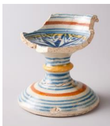
Zoutvat, 16de-17de eeuw, gevonden in Bergen, rue Jean Lescarts, vervaardigd in Antwerpen, faïence, Antwerpse majolica. Collectie van het Agence wallonne du Patrimoine.

Een gelegenheid om de topografie, het stadsplan en het roerende en onroerende erfgoed van de stad Bergen te ontdekken op basis van menselijke relaties . Hoe worden menselijke nederzettingen bepaald door de natuurlijke omgeving? En hoe heeft de stedenbouwkundige opbouw van de stad zich ontwikkeld en de relaties tussen mensen beïnvloed? Welk erfgoed en overdracht vinden we in de moderne Bergense samenleving terug? Welke menselijke interacties, architectuur en stedenbouw willen we morgen zien?